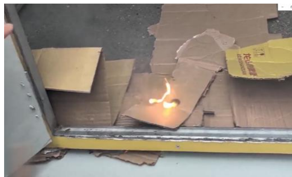
图8 烟蒂引燃包装纸箱实验