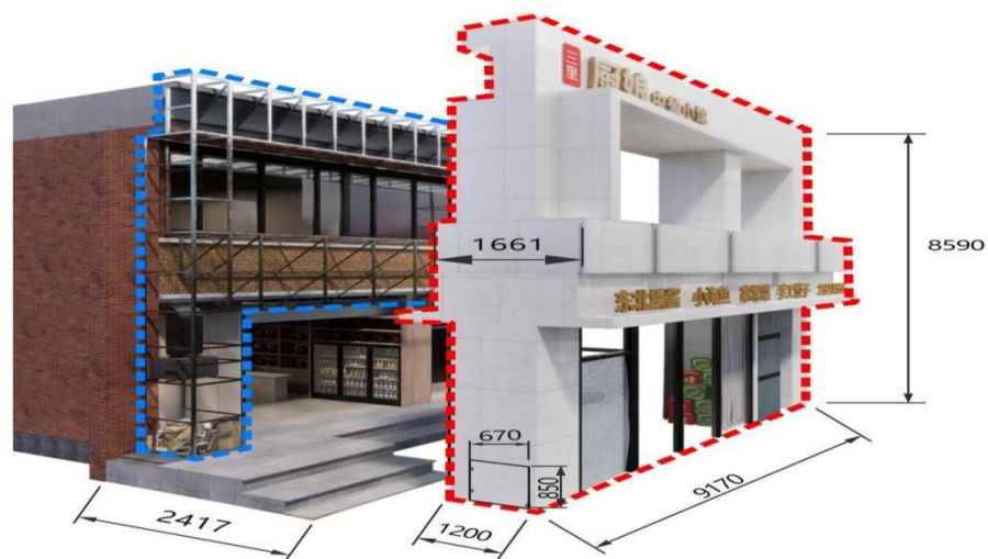
图3 饭店外立面整体结构示意图（单位：毫米）