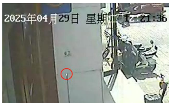
图6 排风道检修口缝隙最早出现火光 （视频时间比北京时间慢49秒）