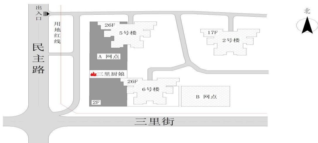
图 1 三里厨娘饭店位置示意图

饭店共两层，一层为前台、散台、厨房和卫生间；二层设 8 个包房和 1 个卫生间。饭店设有 1 个直通室外的安全出口（饭店大门）和 1 部室内楼梯。见图 2。