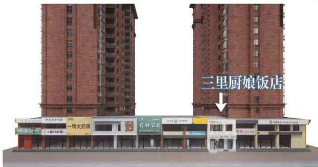
图 4 涉事建筑示意图